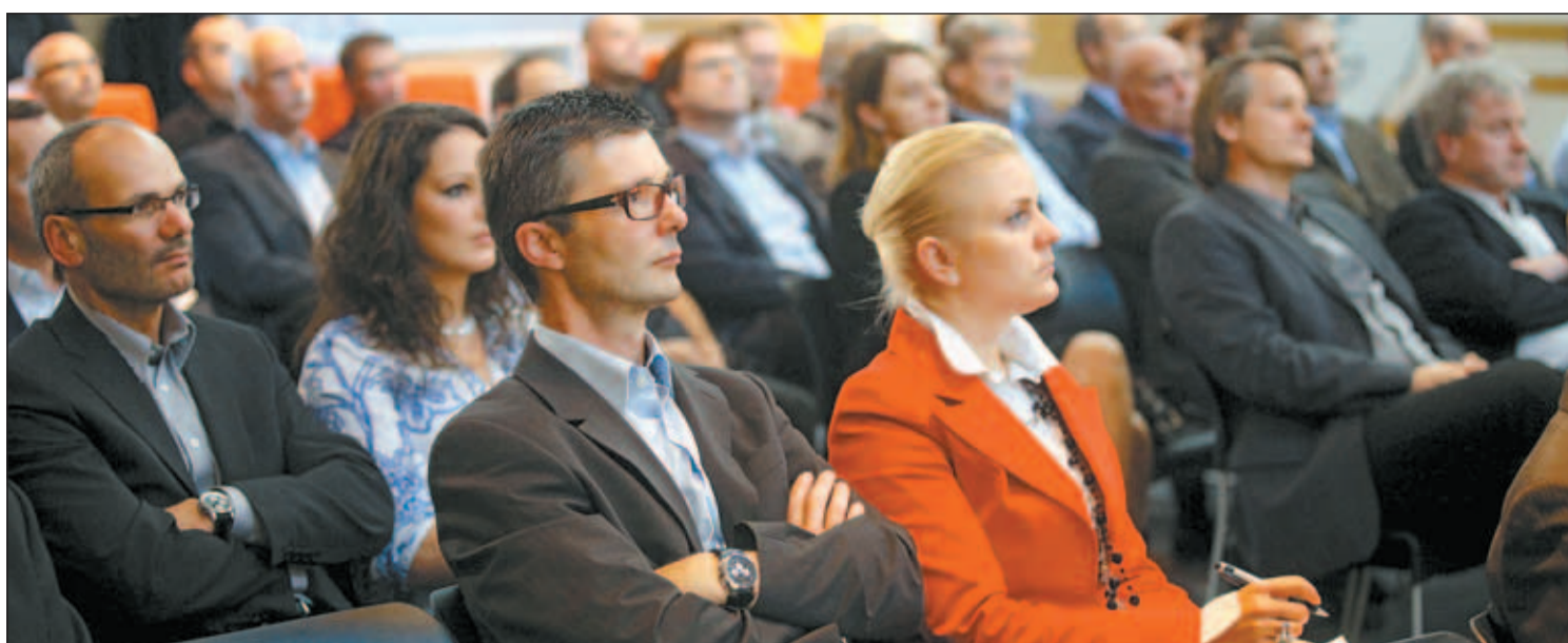
Die Veranstaltungsserie Innovation(night stößt auch im 6. Jahr noch immer auf starkes Interesse.